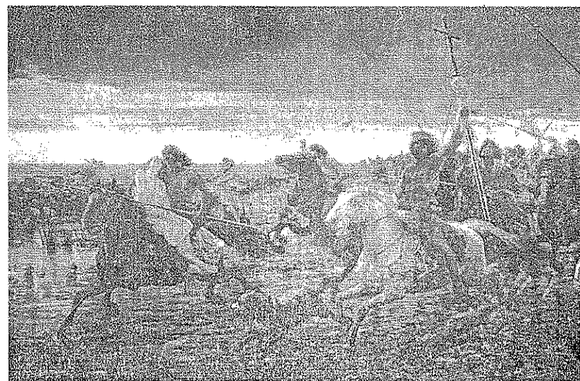
(La vuelta del malón por Della Valle, 1892).