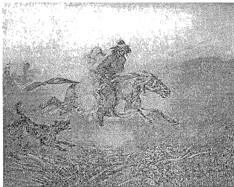
(El rapto de la cautiva por Rugendas, 1845)